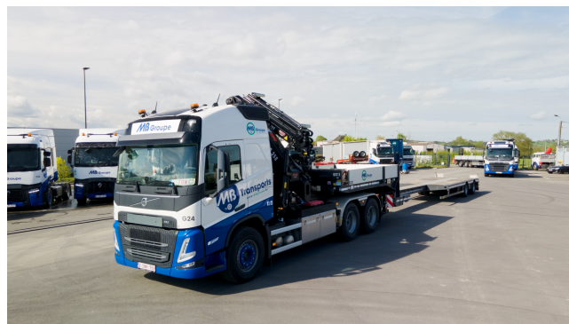
SS11 avec flèche déployée + semi fermée et rallongée