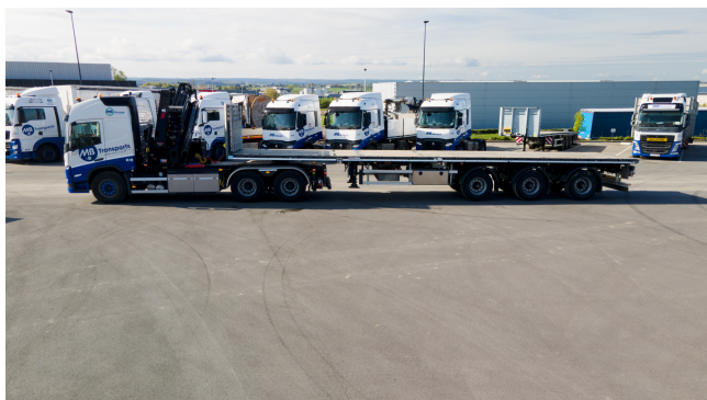
SP18 avec flèche déployée + semi fermée et rallongée