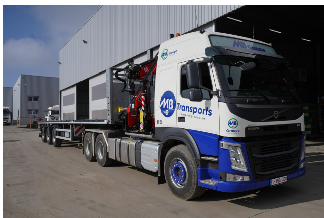
Semi-plateau extensible directionnel (SP8 - SP16 - SP17 - SP18)